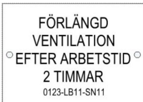
Figur: Skylt för förlängd ventilation efter arbetstid

Timer för förlängd drift ska vara utrustad med indikering som visar om timerfunktion är aktiv eller om aggregat är i drift. Timerfunktion med förändringsbara värden ska finnas i DUC. Skylt där funktion framgår ska monteras i anslutning till timer.