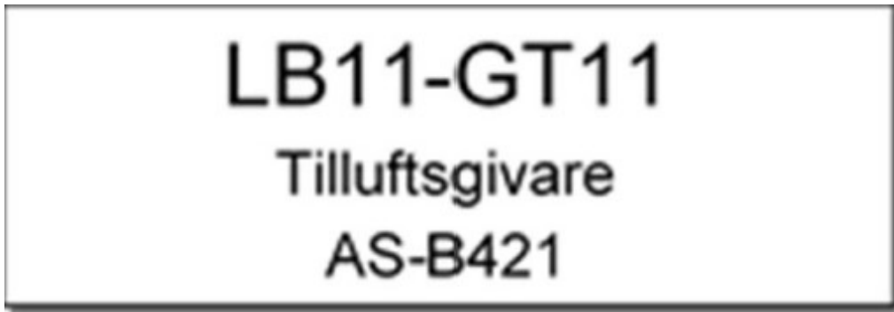
Figur: Märkskylt för apparat och komponenter

Skylt ska fästas med skruv alternativt med buntband av UVbeständig plast eller nylon på komponents elledning. Skylt ska inte fästas på lock.